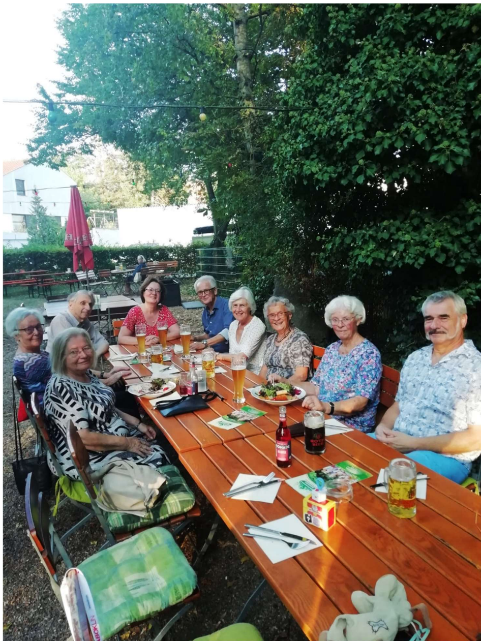
Das einzige Ferientreffen am 5. September 2024 im Naturfreundehaus.